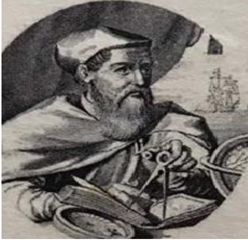
Görsel 4.3. Amerigo Vespucci (K10, 2018 s.66)