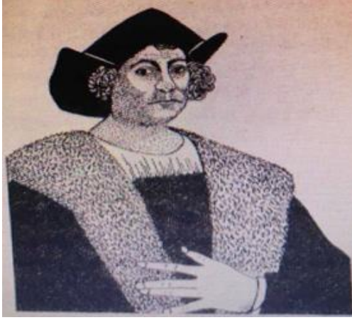
Görsel 4.1. Kristof Kolomb (K4, 1987, s.73)

Kitaplarda en az ise gemi ve pusula görseli kullanıldığını görmekteyiz. Kitaplardaki görsellere aşağıda yer verilmiştir.