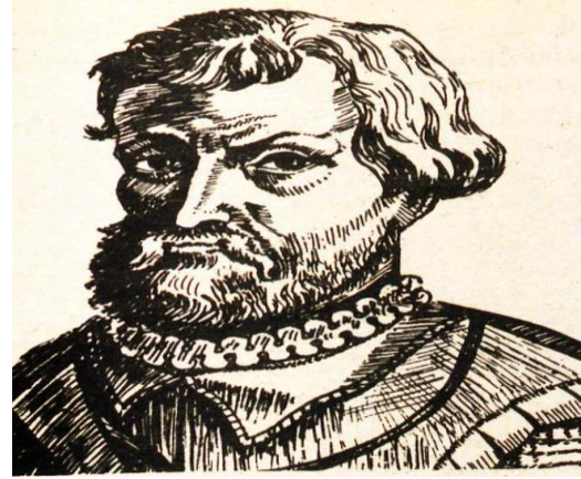
Görsel 4.2. Macellan (K5, 1989, s. 75)