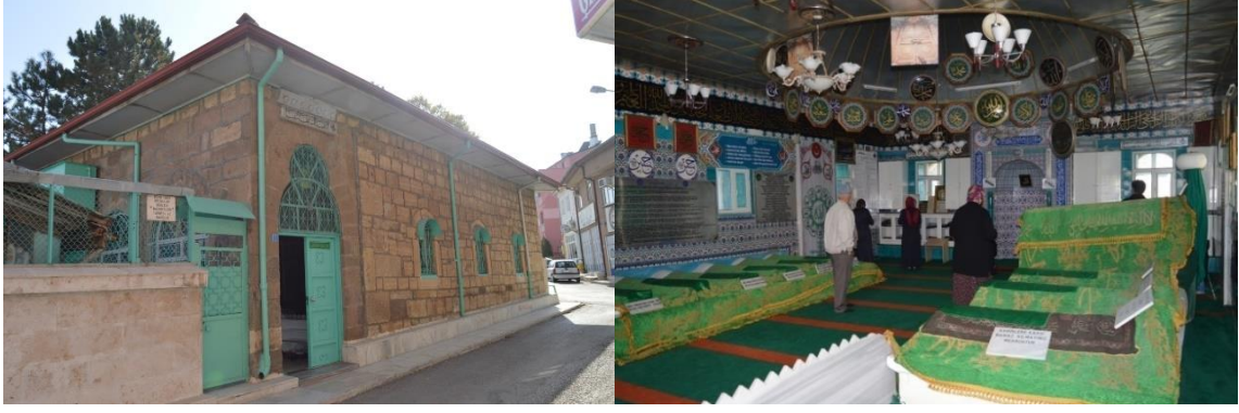
Foto 11. Şeyh Abdullah Efendi Türbesi Her Yıl Yüzlerce Ziyaretçinin Uğrak Yerlerinden Birisidir.