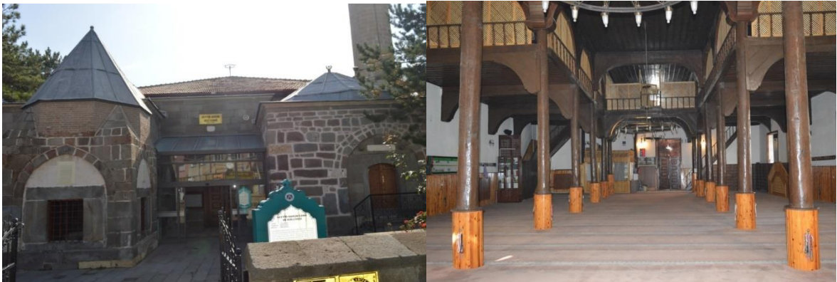
Foto 5. Seyyid Harun Veli Camii ve İçinden Bir Görünüm.