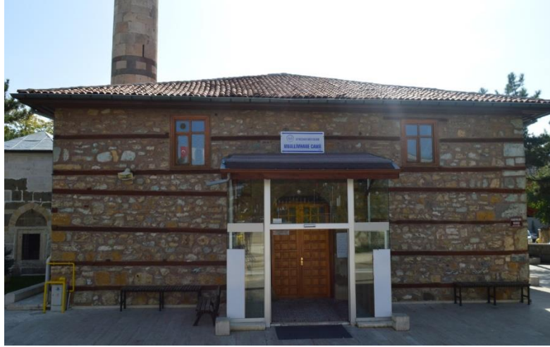
Foto 6. Muallimhane Cami, Dikdörtgen Plan Üzerine Kesme ve Moloz Taşlarla Örülmüş Kargir Duvarlı ve Ahşap Hatıllı Bir Camii'dir.

Muallimhane Camii, Hükümet Meydanı güneyindeki Alaylar Mahallesi'nde bulunmaktadır. Muallimhane Camii, 16. yüzyılda inşa edilmiş bir Osmanlı eseridir. Camii ve Türbe olmak üzere iki bölümden oluşmaktadır. Camii, dikdörtgen plân üzerine kesme ve moloz taşlarla örülmüş kargir duvarlı ve ahşap hatıllıdır(Foto 6). Çok işlek bir meydanda bulunan bu tarihi Muallimhane Camii, yerel halkın ve ilçe dışından gelen insanların ziyaret ettiği ve ibadetlerini yaptığı kutsal bir mekândır.