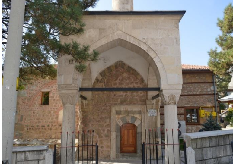
Foto 9. Muallimhane Türbesi, Abdülaziz Ağa Cami'nin Duvarına Bitişik, Dikdörtgen Planlı Bir Türbedir.

Abdülaziz Ağa Camii'nin duvarına bitişik olarak yapılmış olan Muallimhane Türbesi, 4.10x6.55 m boyutunda dikdörtgen planlıdır. İç kısmında doğuda bir kubbe, batıda yarım kubbe ile örtülüdür(Foto 9). Batı cephesi cami ile bitişiktir ve arada minare yer alır. Türbe içten kubbe ile örtülüdür. Dışardan kurşun ile kaplıdır. Muallimhane türbesinde ortada dikdörtgen biçiminde bir seki üzerine ikisi küçük ikisi büyük dört mezar yapılmıştır(Değerli, 2013:196).