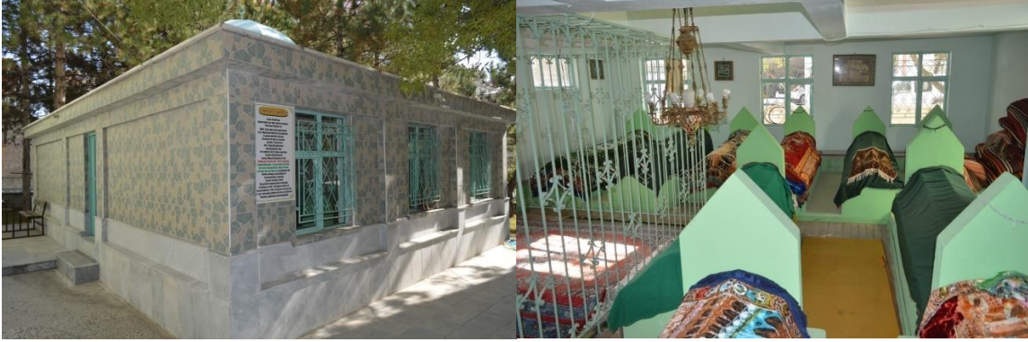
Foto 10. Emirler Türbesi ve İçindeki Mezarlar.