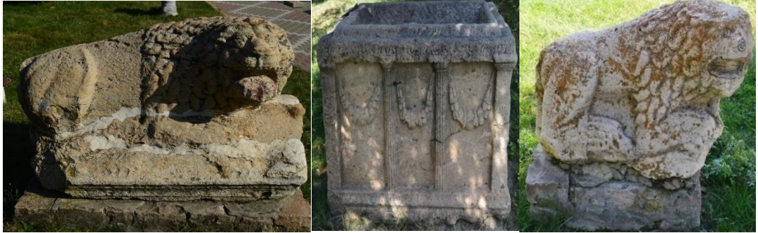
Foto 12. Vasada Antik Kentine Ait Eserler(Seydişehir Belediye Bahçesi).

Seydişehir ilçe merkezinin kuzeydoğusunda 13 km mesafede, Bostandere kasabasında yer almaktadır. M.S. II. Yüzyıla ait Roma antik kenti olup, içinde 1000 kişilik amfi tiyatro mevcuttur(Seydişehir Yerel Dinamikler Ön Raporu, 2013: 89). Vasada antik kentinin bulunduğu alan birinci derece arkeolojik sit alanı ilan edilmiştir. Vasada antik kentinden çıkarılan arkeolojik eserlerin bir kısmı Seydişehir Belediye Parkı'nda sergilenmektedir(Foto 12).