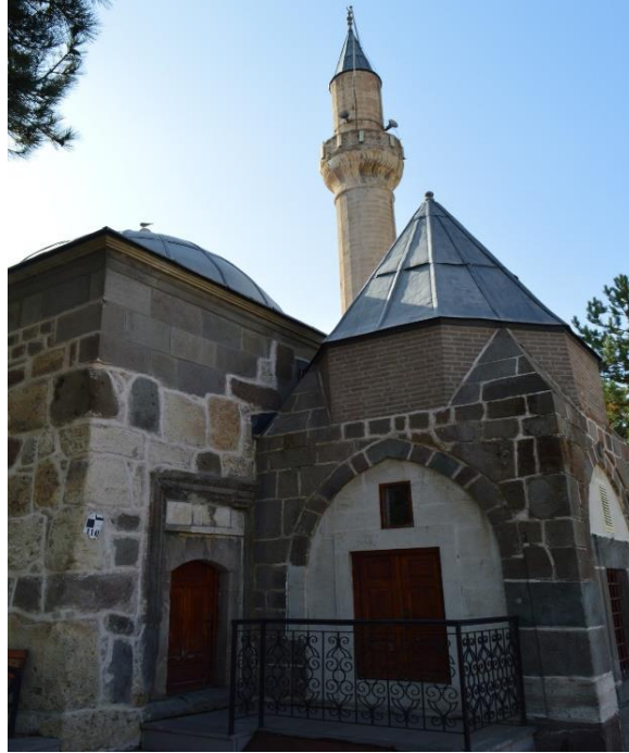
Foto 8. Halife Sultan Türbesi'nden Bir Görünüm.

Seyyid Harun Cami'nin kuzey cephesi önünde sıralanan kümbetlerden ikincisi Halife Sultan Türbesi'dir(Foto 8). Haziran 1367 de yapılan türbede Seyyid Harun Veli'nin kızı Halife Sultan'ın Mezarı bulunmaktadır.