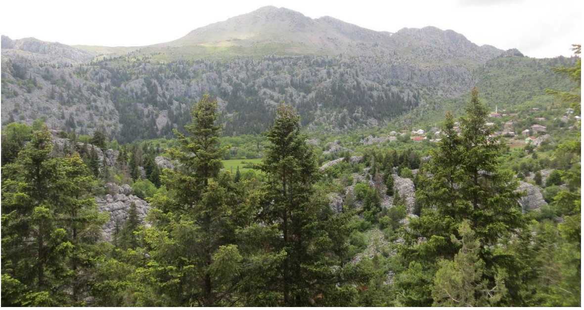
Foto 13. Seydişehir İlçesinde Yaylalar Son Yıllarda Yerli ve Yabancı Turistlerin Rekreasyon Amaçlı Kullandıkları Yerlerden Birisidir. Fotoğrafta Madenli Yaylası Sahip Olduğu Doğal Güzellikler ile Dikkat Çekmektedir.