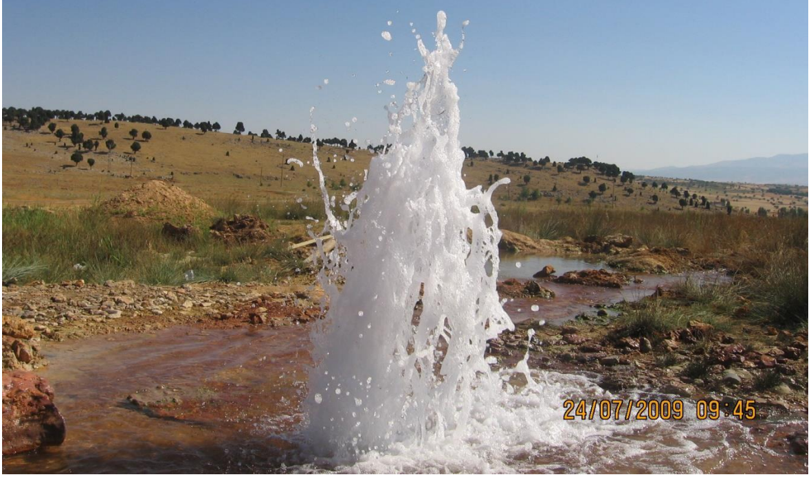
Foto 4. Kavakköy Termal Sahasında Açılan Birinci Kuyu'dan Çıkan Termal Sular.