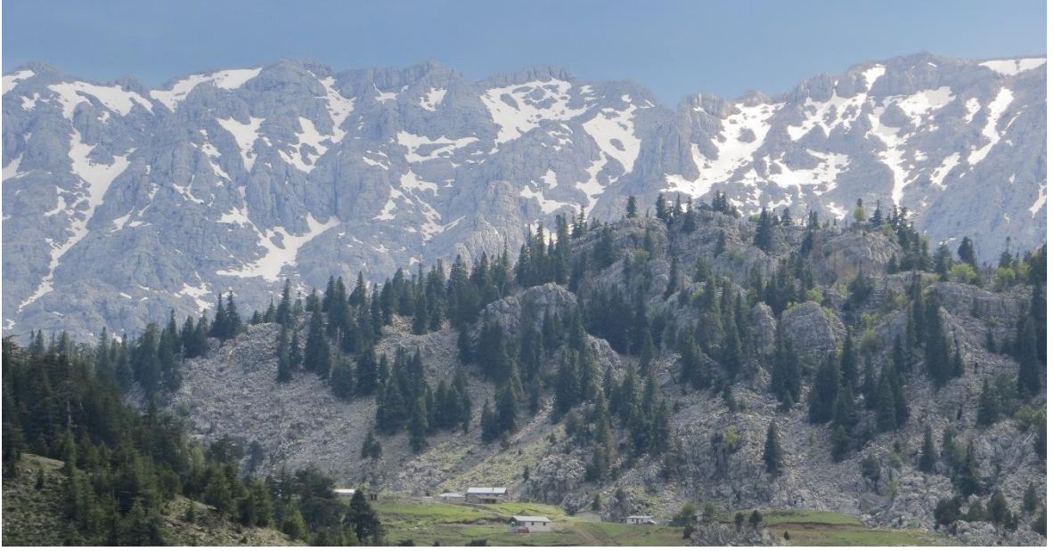
Foto 2. Gidengelmez Dağları Sahip Olduğu Jeolojik, Jeomorfolojik, Flora ve Fauna Özellikleri ile Bilim Turizmine Uygun Dağlarımızdan Birisidir.