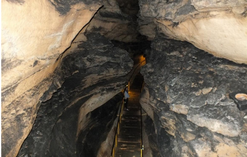
Foto 1. Tınaztepe Mağara Sistemi'nin, Kretase Yaşlı Kalkerler İçerisinde, Yatay Yönde Gelişmiş Kolu. Yapılan Teknik Düzenlemelerle Her Yıl Binlerce Yerli ve Yabancı Turist Tarafından Ziyaret Edilmektedir.

Tınaztepe Mağarası ve çevresi jeolojik ve jeomorfolojik özellikleri ile ziyaretçilerin ilgisini çekmektedir.