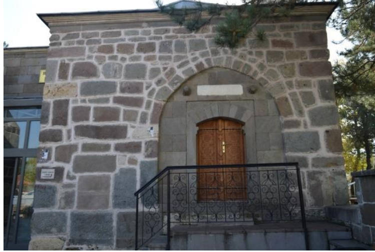
Foto 7. Seyyid Harun Türbesi, Kesme Taştan Yapılmış Kümbet Şeklinde Bir Türbedir. Türbe Kapısı, Konya Müzesine Nakledilip, Yerine İmitasyonu Yapılarak Takılmıştır.