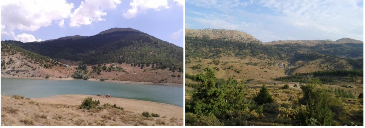
Foto 4-5. Kürebeli Yaylası'nın güney ve orta kesimlerinden birer görünüm.