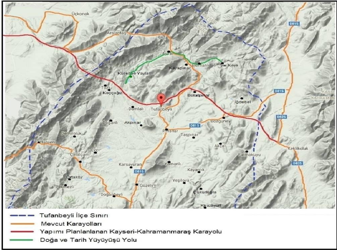
Şekil 1. Tufanbeyli'de mevcut olan ve planlanan yollar.

Yapımı planlanan Kayseri-Kahramanmaraş karayolunun yeni güzergâhı Tufanbeyli ilçe merkezinden geçecek olup, bu yol hizmete girdiği zaman, ilçeye gelen turist sayısı da artacaktır. Çünkü bu yol Kayseri-Tufanbeyli sınırını oluşturan Tahtalı Dağları'nı 5 km'lik bir tünelle geçeceği için ulaşımı kolaylaştıracaktır (Tufanbeyli Belediyesi). Tufanbeyli ilçe merkezine, Kürebeli Yaylası'na ve Şarköy kırsal mahallesinde bulunan antik kente varmak isteyen turistlerin buralara ulaşımı daha kolay olacaktır (Şekil 1).