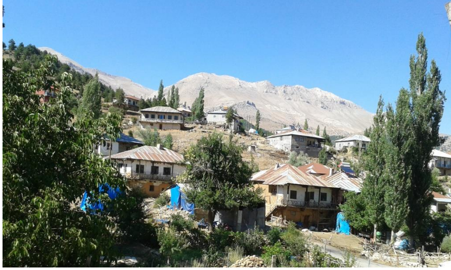
Foto 1. Ayvat kırsal mahallesindeki yöresel mimari.

ürünleri, hayvansal ürünler, el dokuması ürünler ve yöresel mimari yapısı bozulmamış konutlar kırsal turizm açısından bir potansiyel oluşturmaktadır.