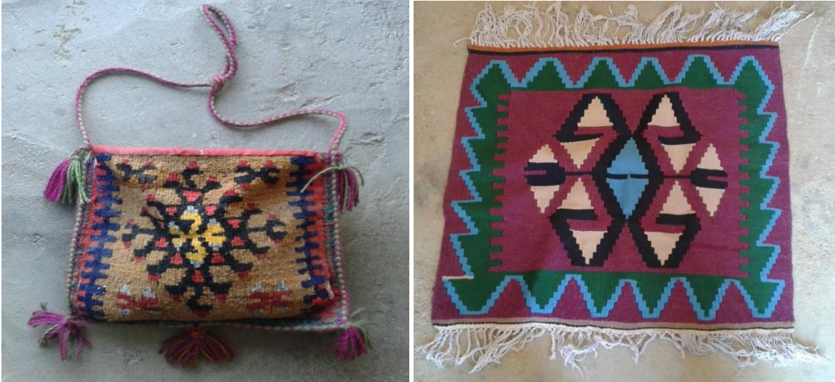
Foto 15-16. Tufanbeyli ilçesinde dokunan, el dokuması çanta ve paspas.

Tufanbeyli ilçesine gelen turistlere bazı etkinlikler yaptırılabilir. Bu etkinliklerden birinde, yöredeki kilim dokuma tezgâhları olan ıstarlarda turistlere kısa süreliğine kilim dokutulabilir. İlçede dokunan kilim, yolluk, heybe, çanta, paspas tarzı dokumalar hediyeelik eşya olarak turistlere satılabilir (Foto 15-16).