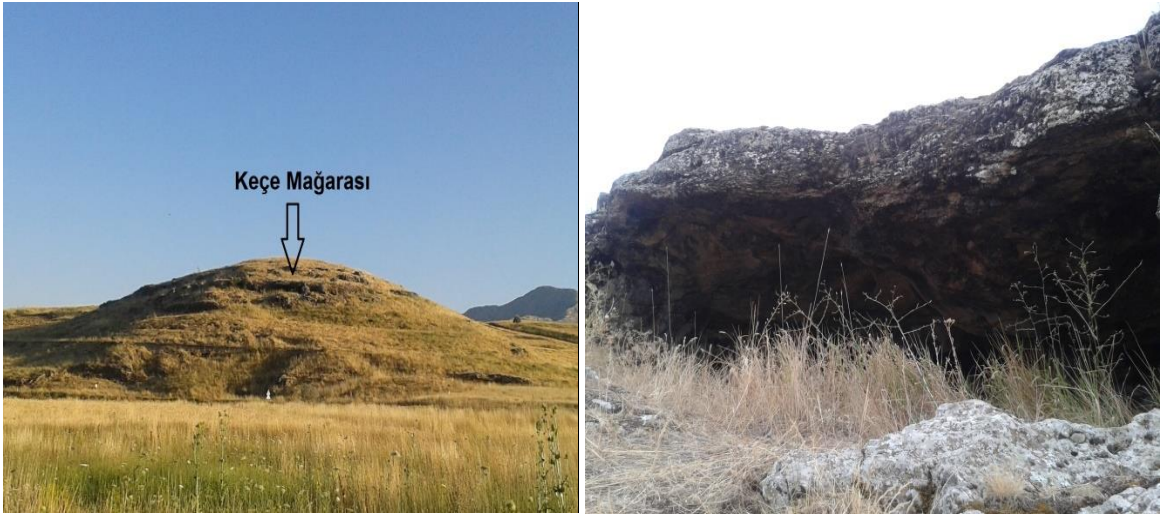
Foto 11-12: Gala Tepe'nin güney yönünde bulunan ve üzerinde Keçe Mağarası'nın bulunduğu tepe ve mağaranın girişi.

Burada biriken alüvyal malzeme Gala Tepe çevresinde olması muhtemel tarihi yapıların üzerini kapatmış olmalıdır. Çünkü bölgedeki tarlalar ekim için traktörle sürüldüğünde, toprak altından bazı yapılara ait olması muhtemel taş ve mermer parçaları ile pişmiş topraktan yapılmış eşya parçaları çıkmaktadır. Bu durum hem tarafımızca gözlenmiştir hem de daha önceden çıkan bazı parçaların bölgede bulunan tarlaların kenarlarında durduğu tespit edilmiştir. Bu alan Damlalı Deresi ve Gücüllü Deresi'nin Göksu Irmağı'na döküldüğü yere yaklaşık 300 metre mesafededir. Gala Tepe'nin hemen dibinde, doğu ve güneydoğu yönlerinde birer tane pınar bulunmaktadır. Gala Tepesi'nin yaklaşık 150 metre güneydoğusunda, küçük bir tepenin kuzey yamacında Keçe Mağarası adında geniş bir mağara bulunmakta olup (Foto 11-12), mağaranın bulunduğu tepenin kuzey tarafında da bir pınar vardır. Bu mağara, insanlar tarafından mesken olarak kullanılmış olabilir. Gala Tepe'nin ve Keçe Mağarası'nın bulunduğu tepenin eteğinde bulunan bu pınarlar daha önce buraya yerleşmiş insanların içme suyu ihtiyacını karşılamış olmalıdır. Gala Tepe ve çevresinde yapılacak olan kapsamlı bir kazı çalışmasında çıkarılacak olan arkeolojik malzemeler Tufanbeyli'de kurulacak olan arkeoloji müzesinde sergilenebilir. Ayrıca, Tufanbeyli-Adana karayolunun 3. km'sinde, yolun hemen kenarında bulunan Gala Tepe ve çevresi de açık hava müzesi olarak ziyarete açılabilir.