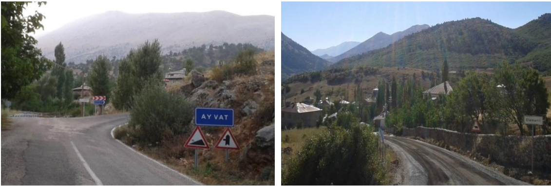
Foto 6-7. Ayvat ve Elemanlı kırsal mahallelerinden görünüm.

Kürebeli Yaylası'na gelen turistler için doğa yürüyüşü kapsamında güzergâhlar belirlenmelidir. Yürüyüş güzergâhlarına turistler için bilgilendirme ve yön levhaları konulmalıdır. Yürüyüş güzergâhları dört seçeneğe şekilde planlanabilir. Birinci güzergâh Kürebeli Göleti'nden başlar, yaylanın en kuzeyinde bulunan Çamlıtomaz Tepesi'ne kadar gidip buradan tekrar başlangıç noktasına dönüş şeklinde olur. İkinci güzergâh Kürebeli Göleti'nden başlar, yaylanın kuzey tarafında bulunan Ayvat kırsal mahallesine kadar gidilip buradan geri dönüş şeklinde olur. Üçüncü güzergâh Kürebeli Göleti'nden başlar, Elemanlı kırsal mahallesine kadar devam eder. Turistler Elemanlı'dan Tufanbeyli ilçe merkezine araçla dönüş yaparlar. Dördüncü güzergâh ise yine Kürebeli Göleti'nden başlar ve Şarköy kırsal mahallesinde bulunan Komana Antik Kenti'nde sona erer. Şarköy'den de Tufanbeyli ilçe merkezine araç ile dönüş yapılır (Foto 6-9). Dördüncü güzergâh en uzun güzergâh olup, bu güzergâhın adı doğa ve tarih yürüyüşü yolu olarak isimlendirilebilir.