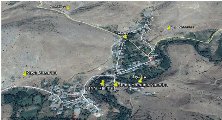
Şekil 2. Şarköy’de bulunan tarihi kalıntıların köy içindeki konumları.

Şarköy arkeolojik sit alanı içerisinde kalan yerleşmesinin buradan kaldırılarak uygun bir alana taşınması gerekmektedir. Sit alanında bulunan amfi tiyatronun toprak altında kalan kısımları temizlenmeli, tarihi eserlerin etrafına sonradan yapılan yapılar yıkılmalı, daha sonra ise sit alanı ve çevresinde kapsamlı bir kazı çalışması yapılmalıdır (Şekil 2).