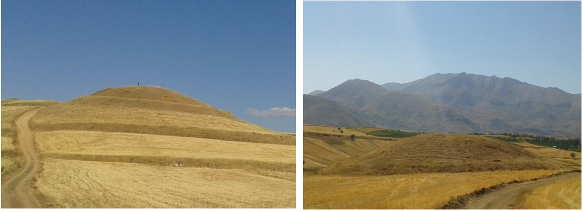
Foto 13-14: Sanfakı Höyüğü'nün batı ve doğu yönlerinden görünümü.