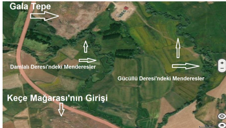
Şekil 3. Damlalı ve Gücüllü Derelerinin oluşturduğu menderesler.

Gala Tepe ve çevresinde tarafımızca bizzat coğrafi arazi araştırması yapılmıştır. Tepenin kuzeyinden Gücüllü Deresi, güney - güneydoğu yönünden ise Damlalı Deresi geçmektedir. Damlalı Deresi ve Gücüllü Deresi, Gala Tepe'nin güneydoğusundan akarken akış hızları burada yavaşlamakta ve dereler burada menderesler çizerek akmaktadırlar. Bu durum derelerin taşkın zamanlarında bünyelerinde taşıdığı malzemeleri burada biriktirmesine ve buradaki alanın üzerinde bir alüvyon tabakası oluşmasına neden olmuştur (Şekil 3).