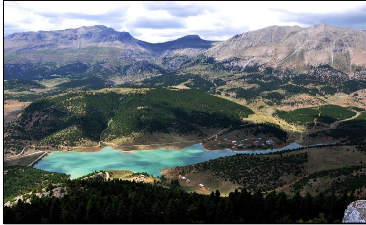
Foto 3. Kürebeli Yaylası ve Kürebeli Göleti'nin doğu yönünden görünümü.

Tufanbeyli'ye gelen turistler için ilçe merkezinin 7 km kuzeybatısında bulunan Kürebeli Yaylası'na da seferler düzenlenebilir (Foto3-5).