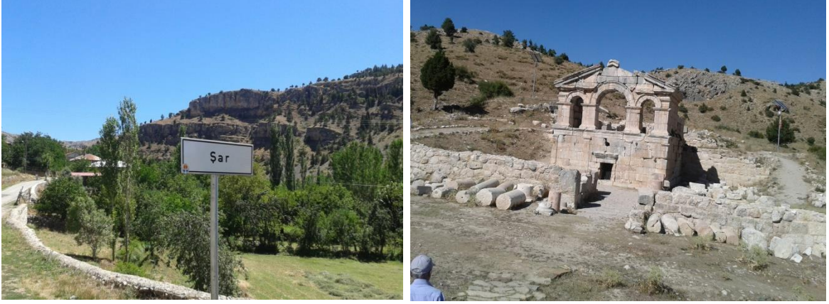
Foto 8-9. Şarköy kırsal mahallesinden ve tarihi kiliseden görünüm.