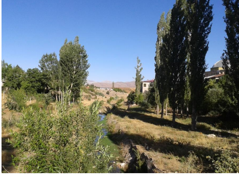
Foto 2. Beşoluk Çeşmesi ile Gücüllü Deresi arasındaki bölümden görünüm.