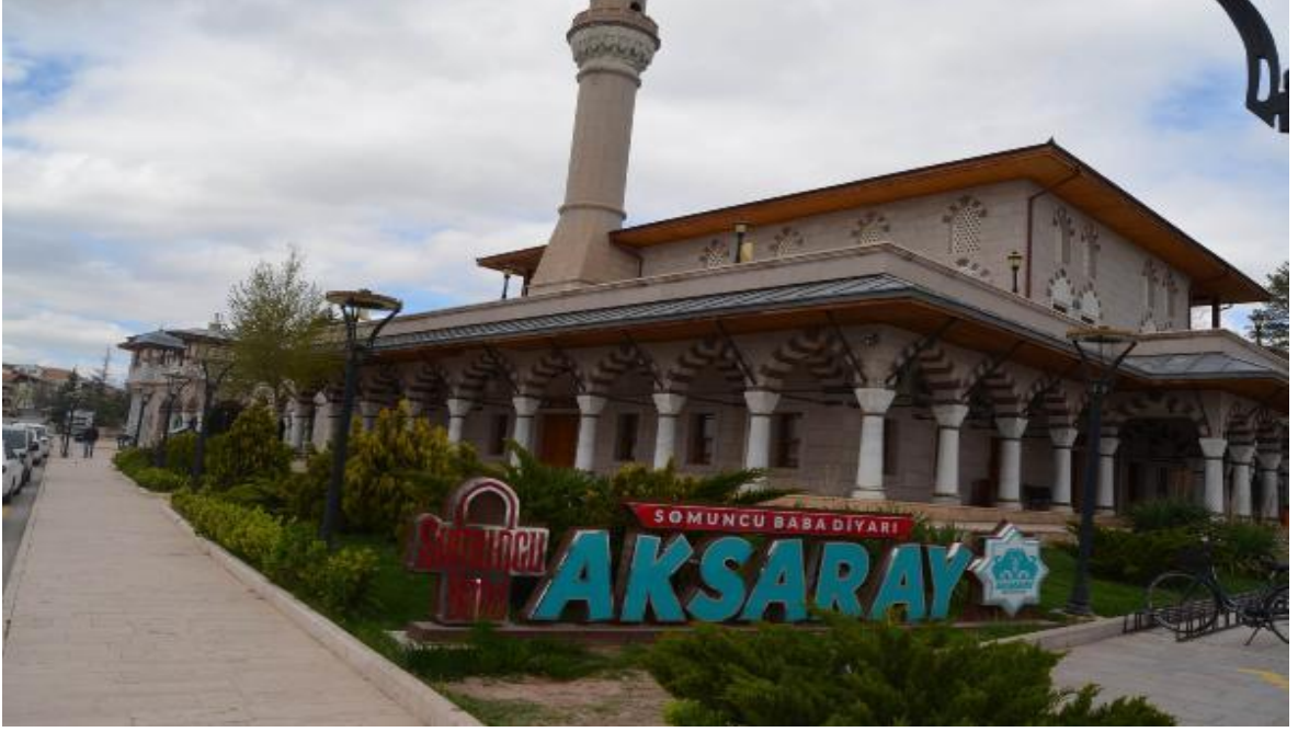
Foto 4: Somuncu Baba Külliyesi ( https://pgnhaber.com/somuncu-baba-kulliyesinde-koronavirus-sessizligi/ ).

3.Hazf: Aradan çıkarma, çıkarılma, yok etme.