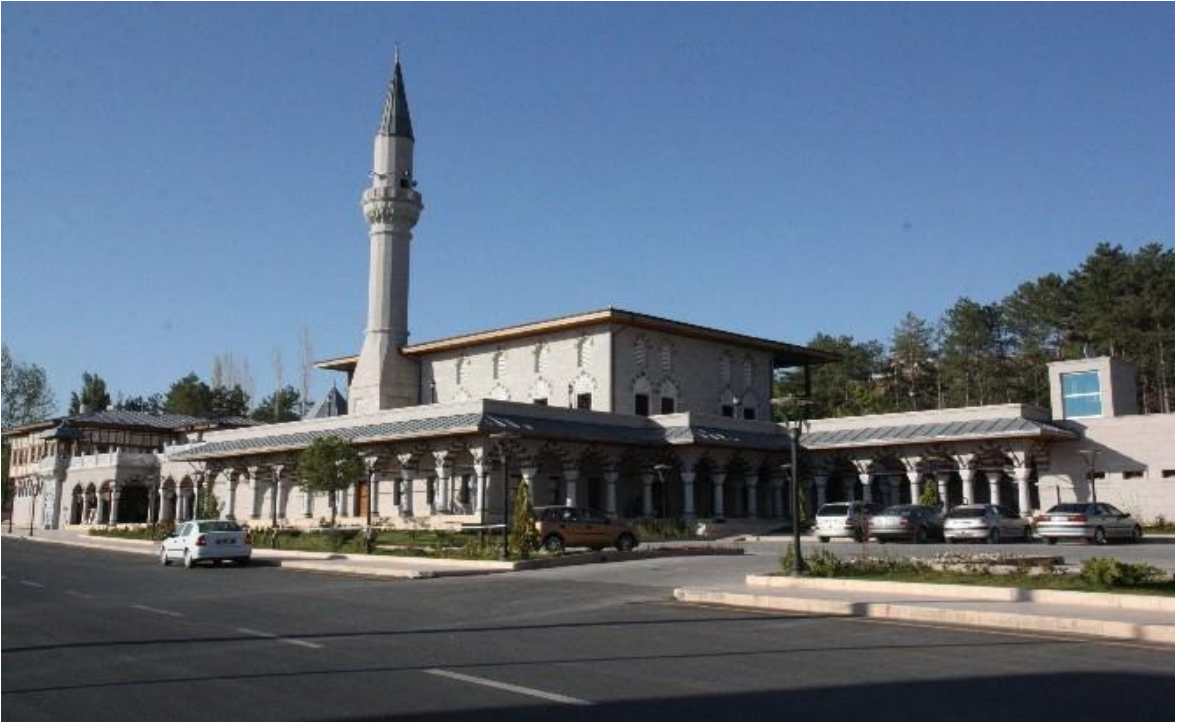
Foto 6: Somuncu Baba Aksaray ( https://www.sabah.com.tr/aksaray/2015/07/09/somuncu-baba-kulliyesinde-internet-hizmeti ).