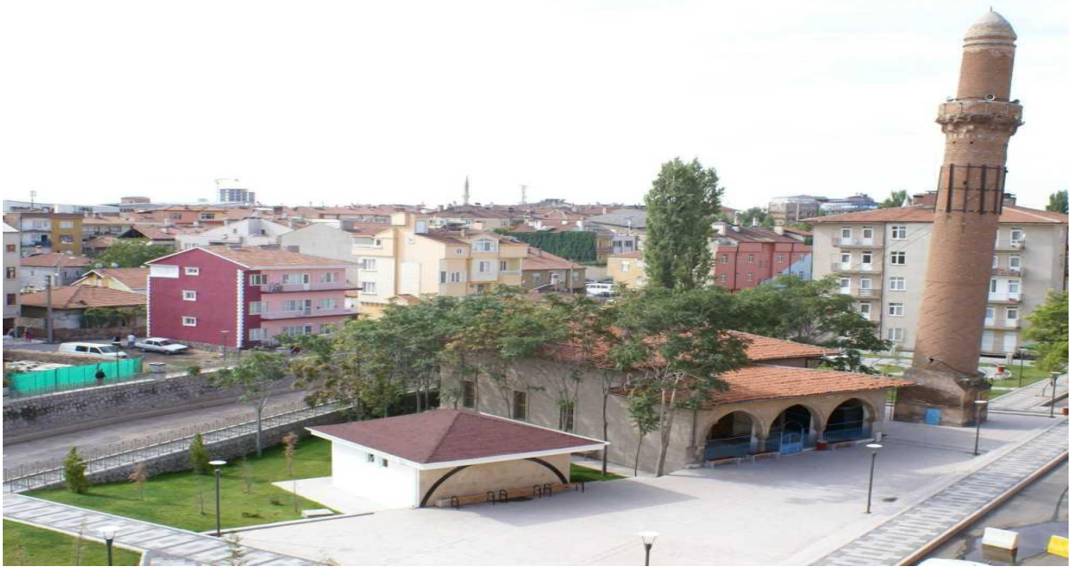
Foto 2: Eğri Minare-Kızıl Minare.

Bölgede bulunan camii, dört köşe bir kaidenin üzerine oturtulmuş bir biçimde, silindirik bir gövdeden oluşmaktadır. Cami, alt kısmı zikzak, üst kısmı ise mavi ve yeşil çini mozaikleri ile kaplı bir yapıdır. Minarenin yıkılma tehlikesi olduğundan dolayı 1973 yılında çelik halatlarla bağlanmıştır ve minarenin yanındaki cami ise sonradan yapılmıştır (Bingöl, 2007; 430).