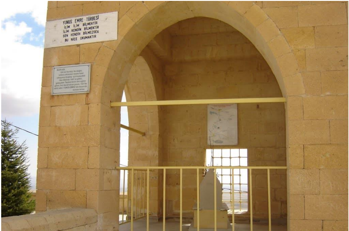
Foto 12: Yunus Emre Türbesi İç Kısmı ( https://mapio.net/pic/p-70178064/ ).

şahısları gönüllerinde yaşatırken, onlara sahip çıkıp kendi beldelerinde olduğunu ileri sürmeleri de gayet tabiidir. Yunus'un on yerde mezarının ya da makamının olması da bu yüzdendir. Bugüne kadar Yunus Emre'nin yaşadığı yer hakkında en çok Eskişehir'in Sivrihisar ilçesi ve Karaman kabul görmüştür. Ancak bazı akademisyenlere göre Ortaköy ilçesinin Hacı Bektaşî Veli ve Taptuk Emre dergâhlarına yakınlığı, rivayetlere göre Yunus Emre'nin bu dergâhlara yürüyerek gidip gelmesi, 40 yıl Taptuk Emre'ye hizmet etmesi bilgileri göz önünde bulundurulduğunda Yunus'un yöremizde yaşadığı ve mezarının Aksaray ilinin Ortaköy ilçesine bağlı Sarıkaraman köyündeki Ziyarettepe denilen mevkide olduğu kabul edilmektedir. Bundan dolayı da Ortaköy İlçesi halkı Yunus Emre'ye sahip çıkmaktadır. Aksaray ilinin Ortaköy ilçe merkezine 20 km mesafede Sarıkaraman köyündedir. Türbenin bulunduğu tepe, halk tarafından Ziyaret Tepesi olarak bilinmektedir, Her yıl ekim ayında Yunus Emre'yi Anma Etkinlikleri düzenlenmektedir. Aksaray ve Kırşehir Valiliklerince dönüşümlü olarak gerçekleştirilen etkinliklere her iki ilin protokolü ile yurt dışından ve yurtiçinden gelen birçok vatandaş katılmaktadır ( http://www.ortakoy.gov.tr/yunusemre E.T: 26.08.2020 ).