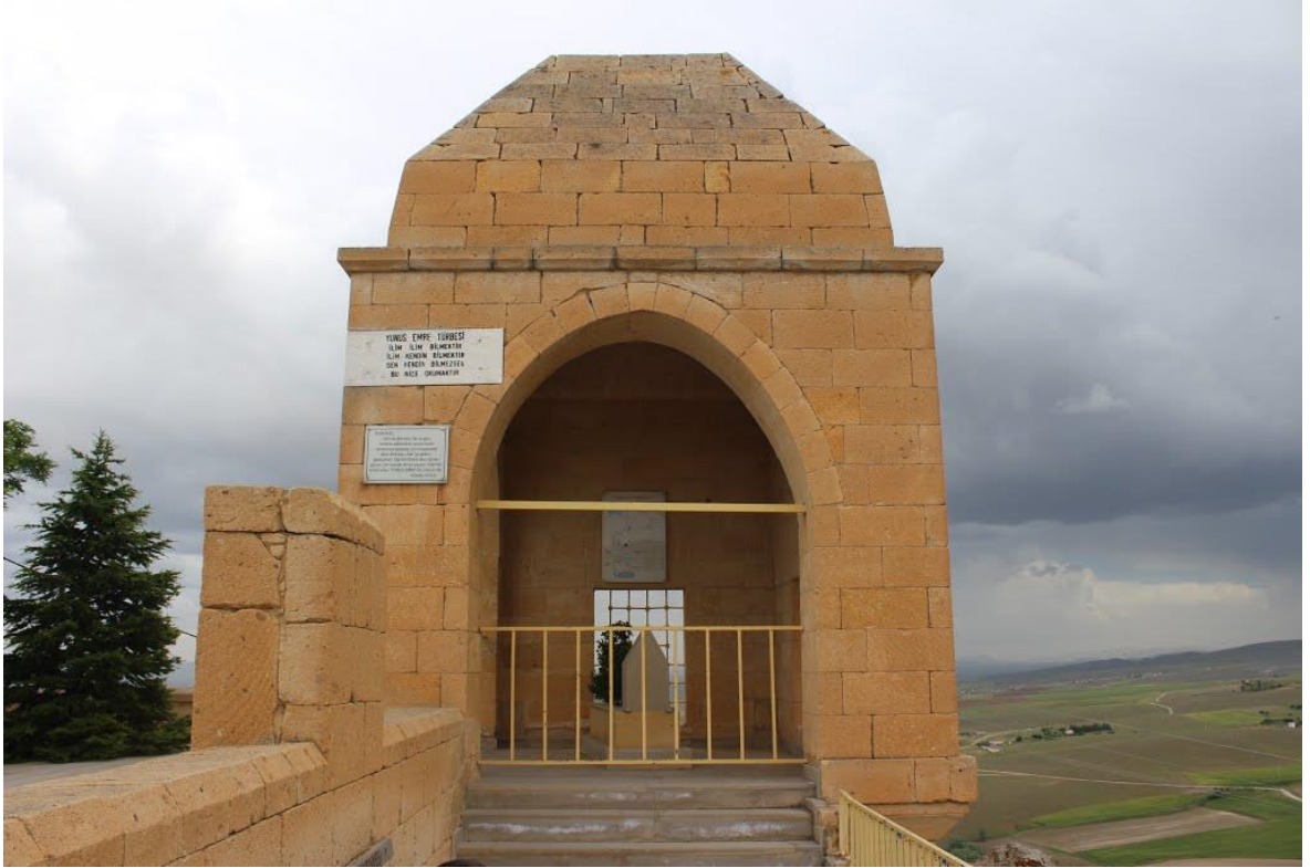
Foto 11: Yunus Emre Türbesi.

Yunus Emre, bu coğrafyanın şahsiyeti, ozanı ve dervişlerinden biridir. Yunus Emre ilahi aşk ile nefsini pişirmiş ve bu aşkın lezzetini yazdığı tüm şiirlerine yansıtan ulvi bir şahsiyettir. Sadece bulunduğu devirin değil, asırlar ötesine nasihatleriyle sesini duyuran yüce bir kişidir. Yunus Emre, nesilden nesile geçen birçok söylemleriyle asırlardır bizim aramızda varlığını sürdürmektedir. Bu kadar bilinmesine ve aramızda varlığını hala sürdürmesine rağmen, maalesef ki hayatı hakkında fazla bilgi elde edilememektedir. Yaşamını sürdürdüğü yerler hakkında birçok söylentiler olmasına rağmen, Yunus Emre'nin şiirlerine, yazdığı menkıbelere bakarak bir ailesinin olduğu, çocuklarının olduğu anlaşılmaktadır. Türk Tasavvuf Edebiyatımızın en yüce şahsiyeti bildiğimiz bu zatın yaşadığı yerin neresi olduğuna dair net bir bilgiye ulaşılamamaktadır. Sebebi ise; söylenen ve elimizdeki bilgilerin kapsamlı olmamasıdır.