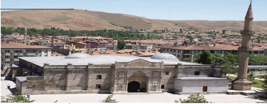
Foto 1: Aksaray Ulu Cami

Selçuklular, Danişmendliler ve Karamanoğulları zamanında da Ulucami'nin bulunduğu yer bir tepe halindeydi (Konyalı, 1974; 1224).