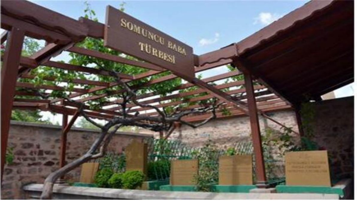
Foto:5 Somuncu Baba Türbesi